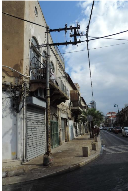
העמוד ברחוב דוד רזיאל פינת רטוש