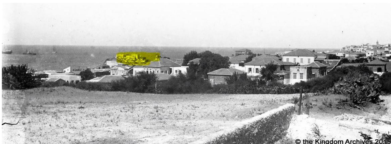
הבית והמראה שנשקף ממנו. בית הקברות עג'מי מסומן בצהוב