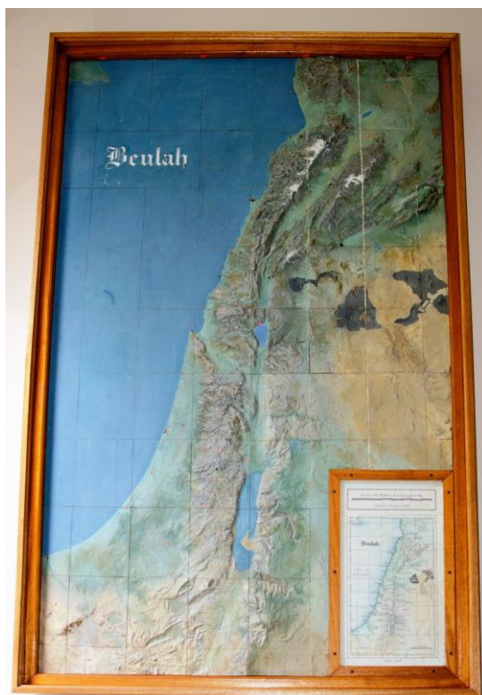
המפה התלת ממדית שגילף ג'וזף הרימן

לבסוף, את האנייה לא יכלו להציל ובאין כל תקוה שברוה ומכרו אותה בתור ברזל חלקים חלקים. הנוסעים האלה הסתדרו במושבות, רבים מהם הנם איכרים בעלי אחוזות ונחלאות ויושבים בארץ ונהנים בה וראו בה כבר בנים ובני בנים העוסקים גם הם בעבודת אדמה ובמסחר בא"י.