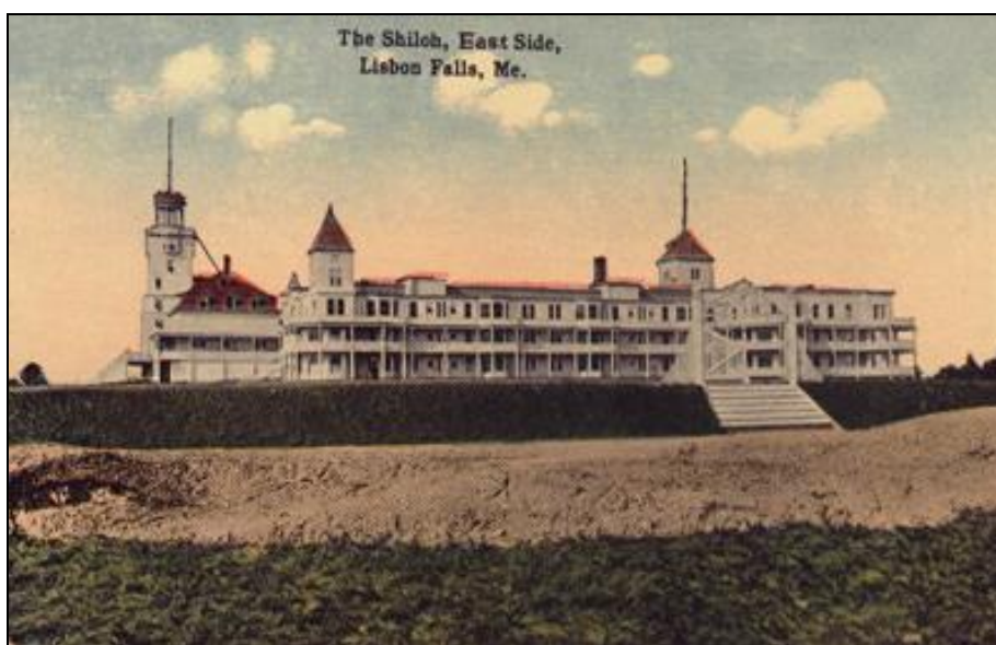
המבנה המרכזי ב'שילה'